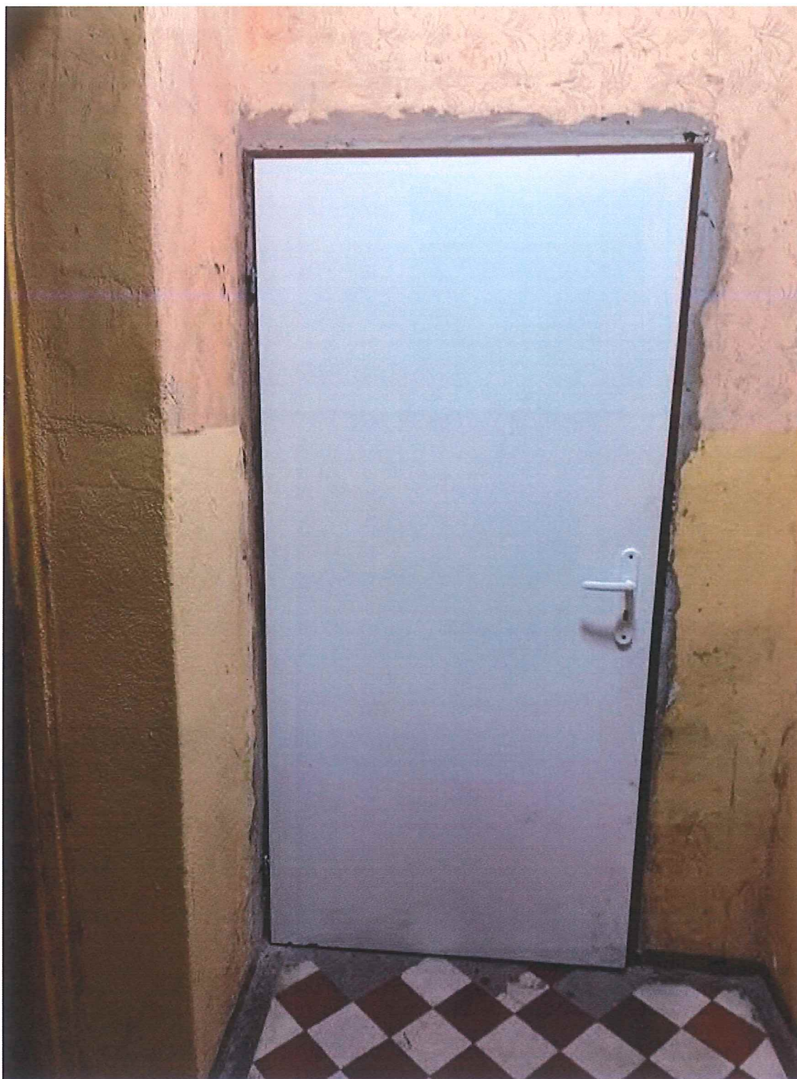
Fot. 4. Widok drzwi do wymiany od wewnątrz.