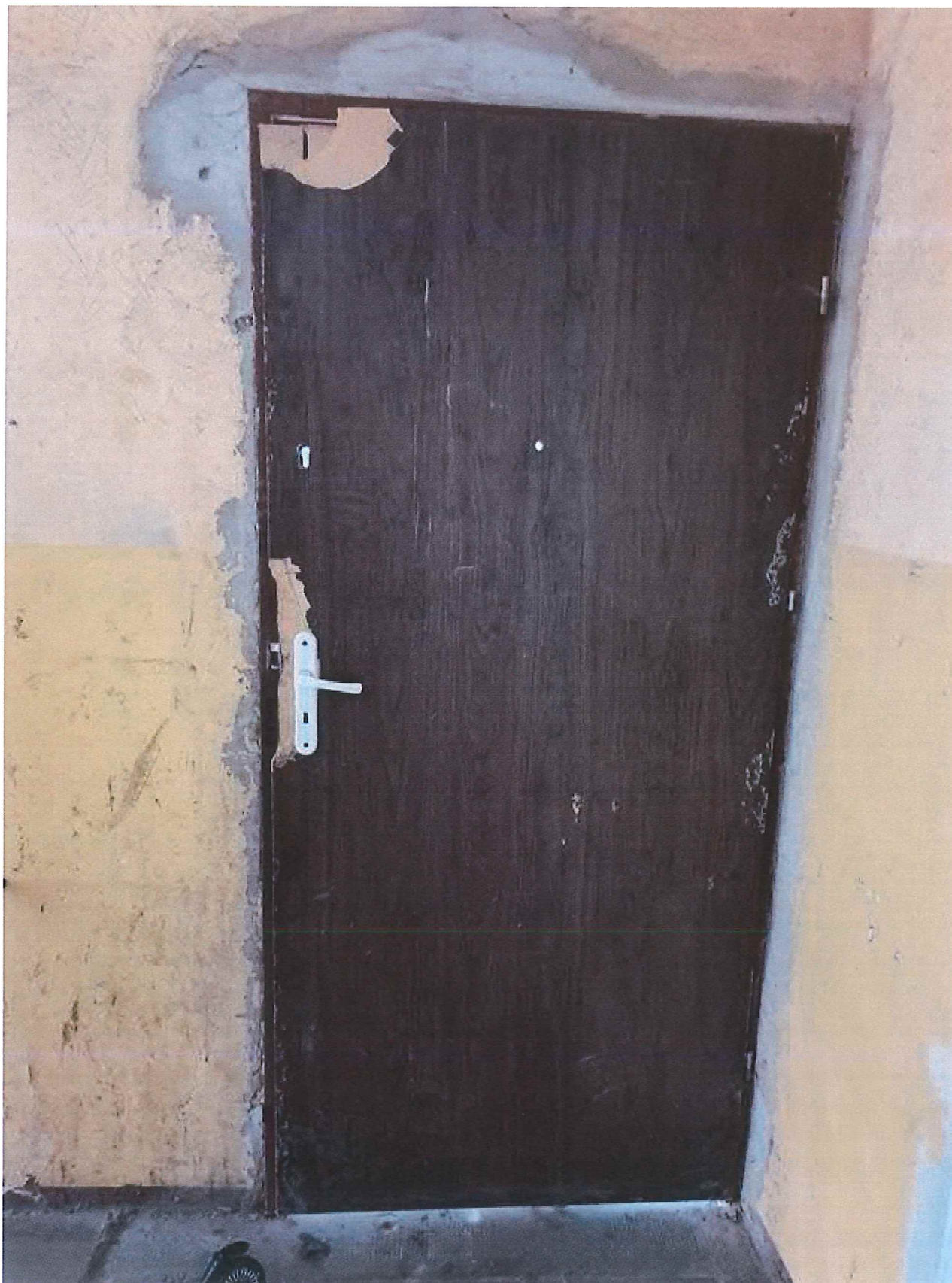
Fot. 2. Widok drzwi do wymiany od wewnątrz.