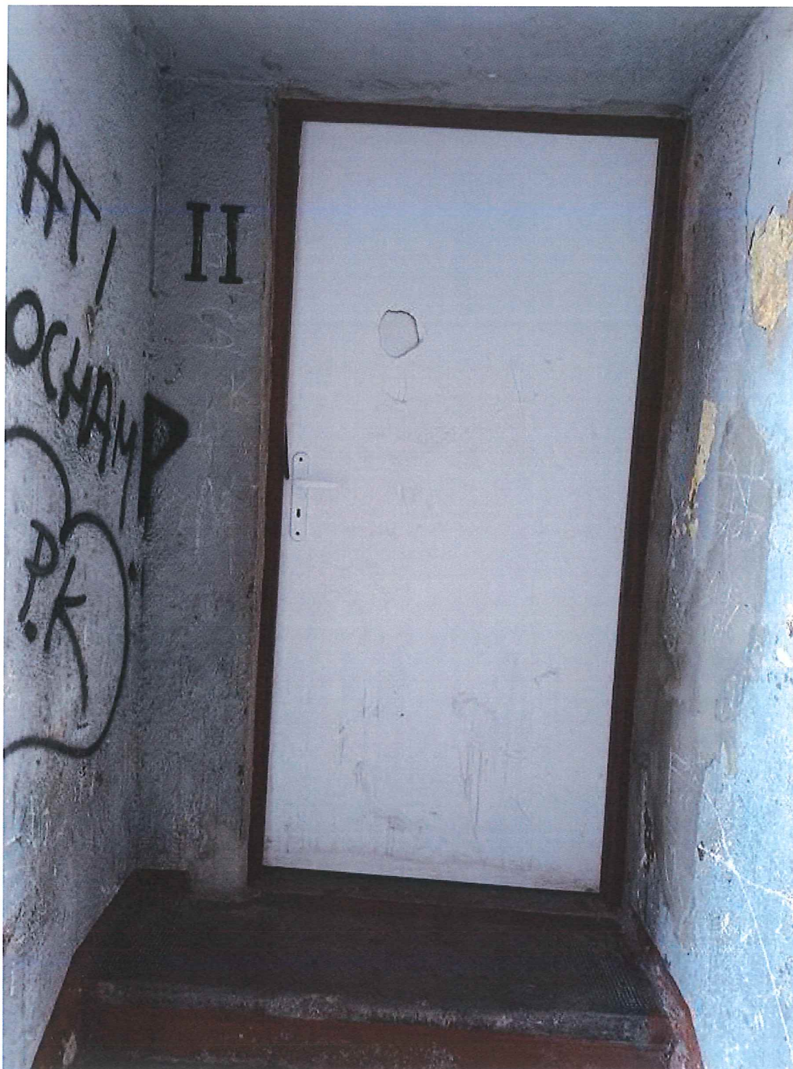
Fot. 3. Widok drzwi do wymiany od zewnątrz.